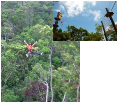
フォレストアドベンチャー＆琉球村