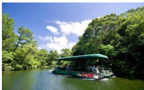
ビオスの丘 沖縄の植物・小動物を分かりやすく紹介する湖水観賞舟。