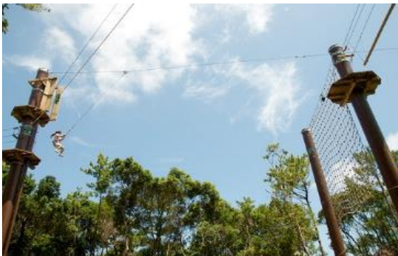
フォレストアドベンチャー&琉球村