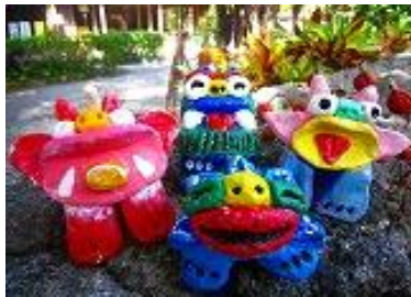
おきなわワールド