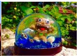
古宇利島オーシャンタワー スノードーム作り体験