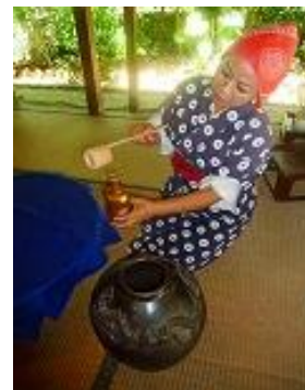
琉球村 ゆしびん体験