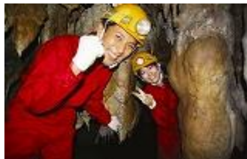
おきなわワールド 洞窟探検(夏季限定)