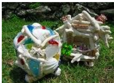
むら咲むら 海のランプ制作体験