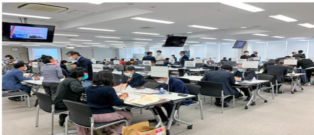
令和3年度の催事開催時の様子